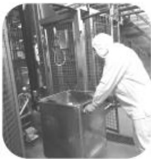
1 - Alimenter les mélangeurs et cuiseurs en matière premières

Le conducteur de ligne fabrication est en charge de la cuisson et texturisation des recettes prévues par le programme de production (Poste en 2* 8)