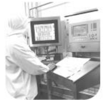
4 - Contrôler la cuisson et pasteurisation